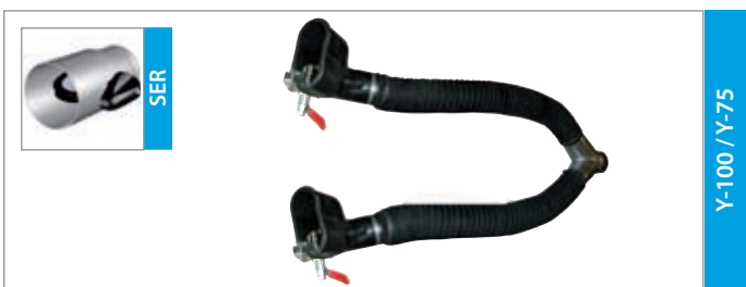
Y-100 / Y-75