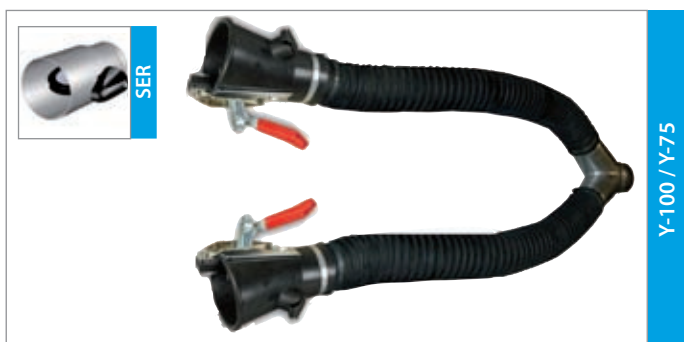
Y-100 / Y-75