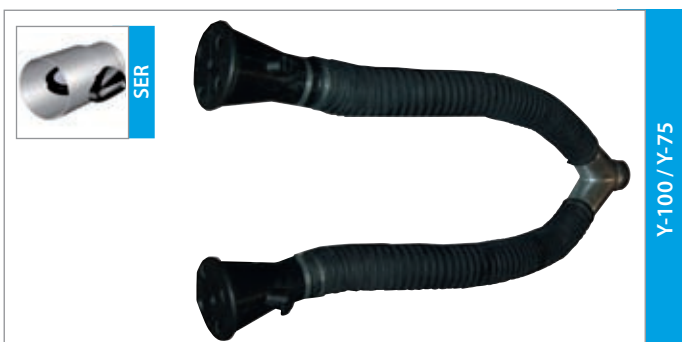
Y-100 / Y-75