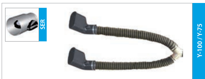
Y-100 / Y-75